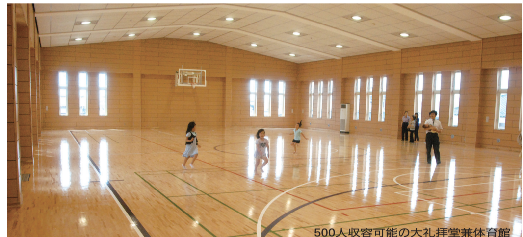
500人収容可能な大礼拝堂兼体育館