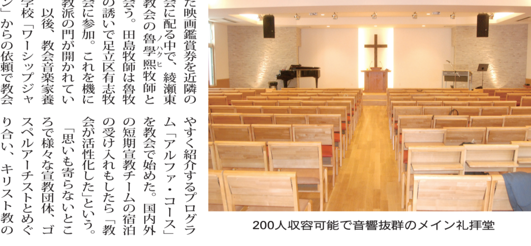
200人収容可能で音響抜群のメイン礼拝堂