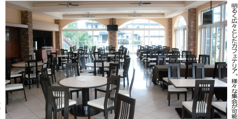
明るく広々としたカフェテリア。様々な集いが可能