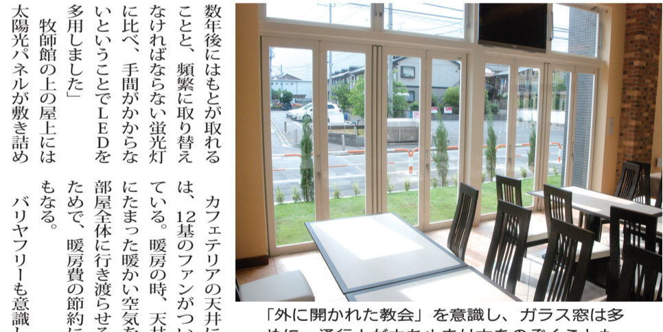
「外に開かれた教会」を意識し、ガラス窓は多めに。通行人が立ち止まり中をのぞくことも