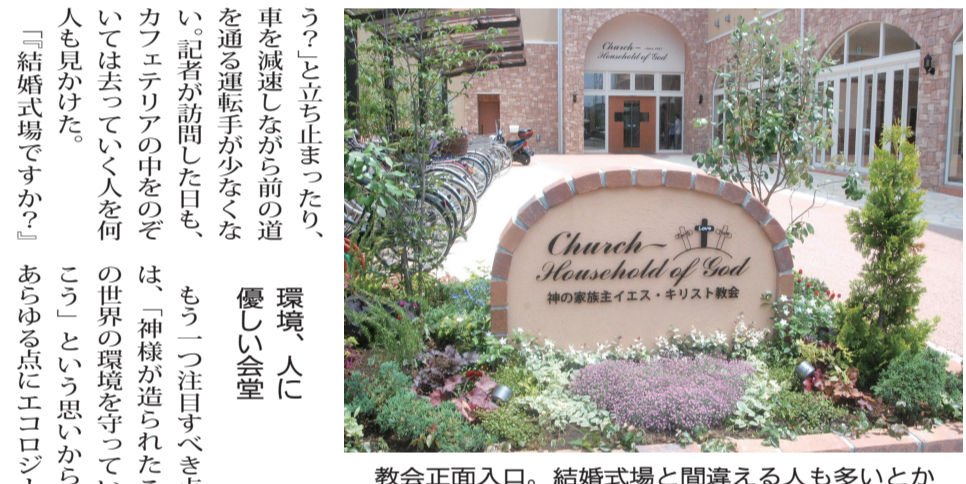
教会正面入口。結婚式場と間違える人も多いとか